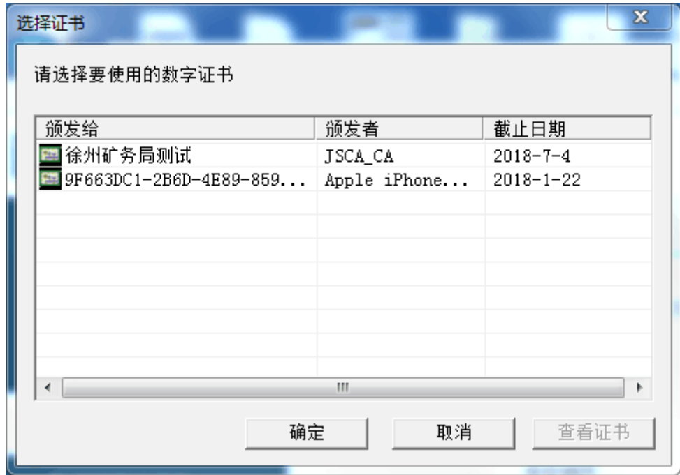
图 9-6 (a)