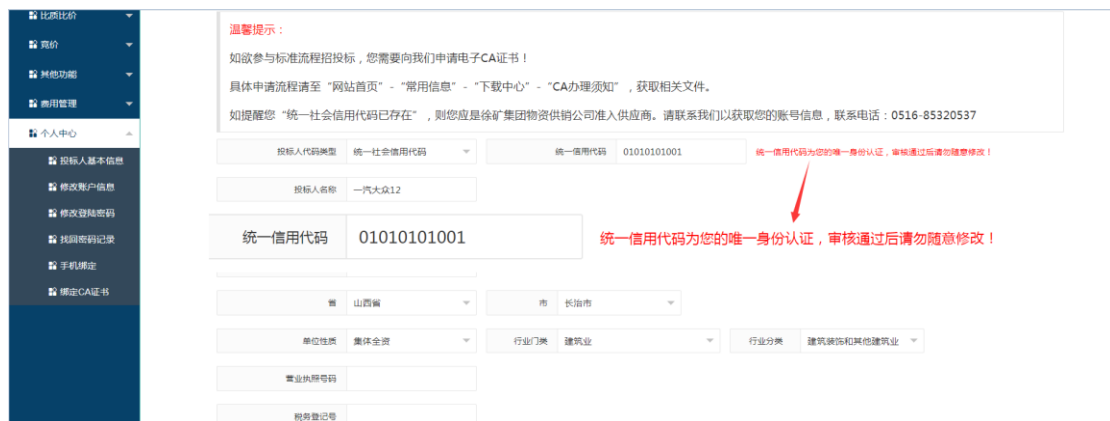
图 9-2 (a)

如图 9-1, 点击“个人中心”会出现下拉菜单, 点击“投标人基本信息”, 如图 9-2(a)和 9-2 (b), 可以修改投标人的基本信息, 每一个信息都必须填写, 如果证件有效期是永久的, 请把日期改成 2099 年 12 月 31 日。